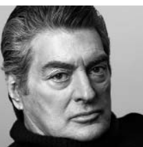
< Алан Сигел США Siegel+Gale