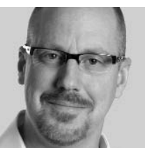
< Лори Розенвассер Великобритания Landor Associates