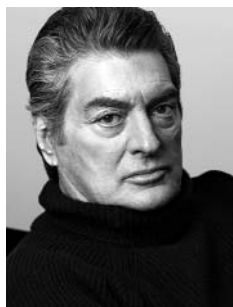
Алан Сигел (США) Основатель и председатель совета директоров Siegel+Gale

Определение понятия Corporate Voice. Разделение компаний мирового уровня по отличительным Corporate Voices и почему они успешны. Возникновение Corporate Voice. Как развить ваш особенный Voice? Какие преимущества вы сможете реализовать в результате?